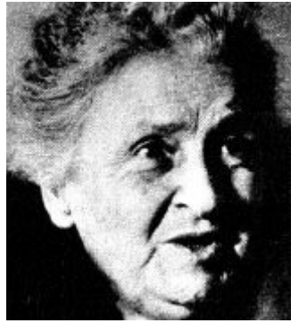
A educadora Maria Montessori: invenção do material dourado para facilitar a aprendizagem das quatro operações

A principal função do material dourado, entretanto, ainda é o estudo das quatro operações fundamentais. Manipulando suas peças da forma correta, é possível somar, subtrair, multiplicar e dividir sem grandes dificuldades, como você verá no final desta reportagem.